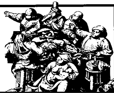
Peter Bruegel il Vecchio, La cucina ricca (1563)

Tecnologi Alimentari a tutela della Qualità