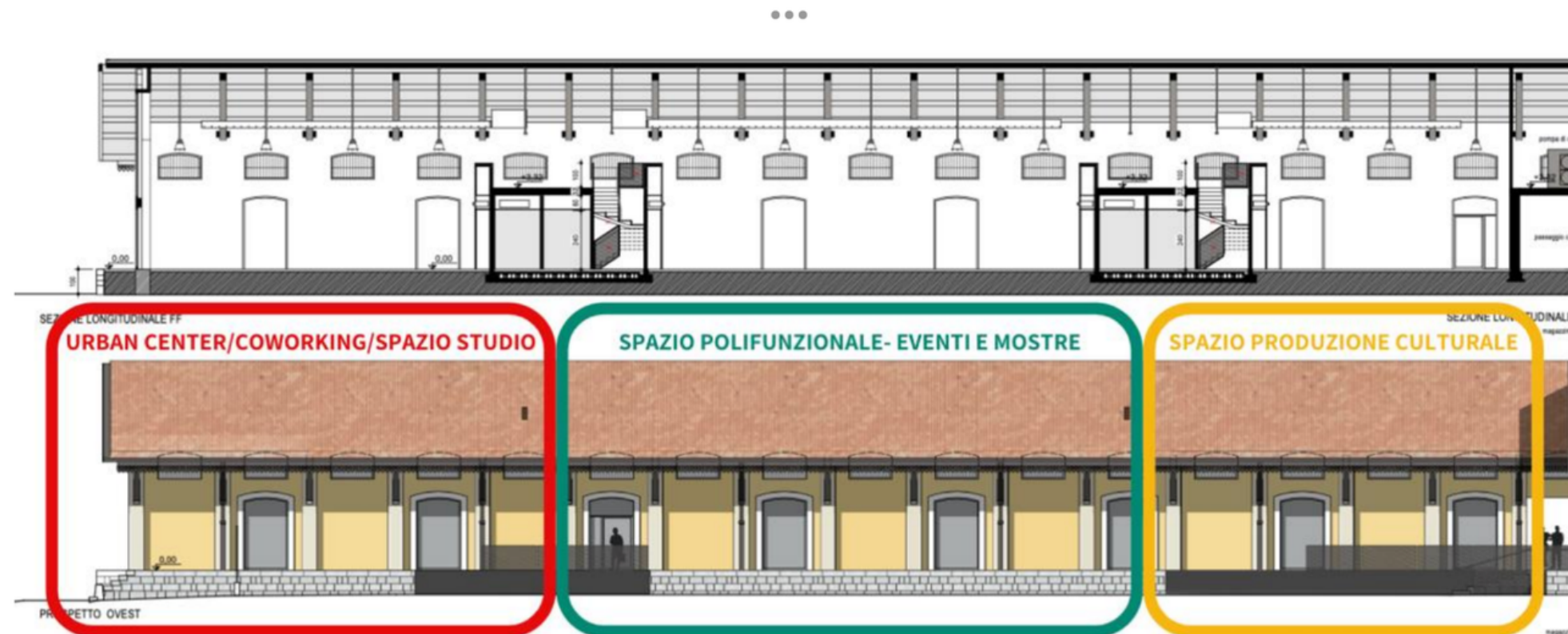
Figura 20. Divisione degli spazi della Stecca Nord su rendering