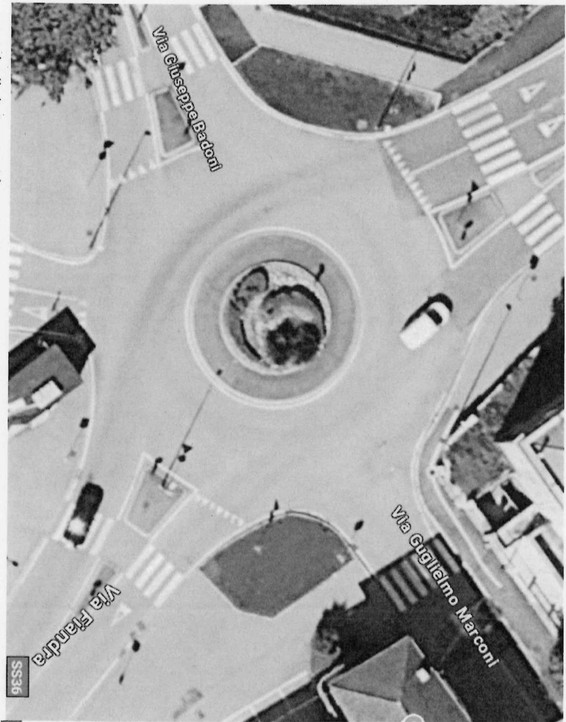
- rotonda di via Marconi | Via Guglielmo Marconi - Google Maps