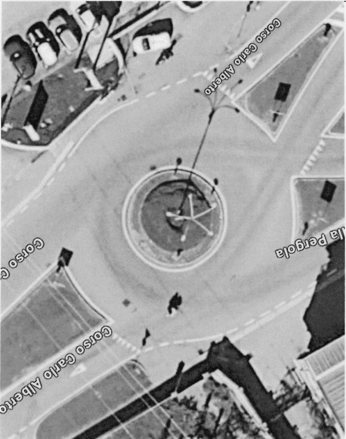
rotonda corso carlo alberto Corso Carlo Alberto - Google Maps