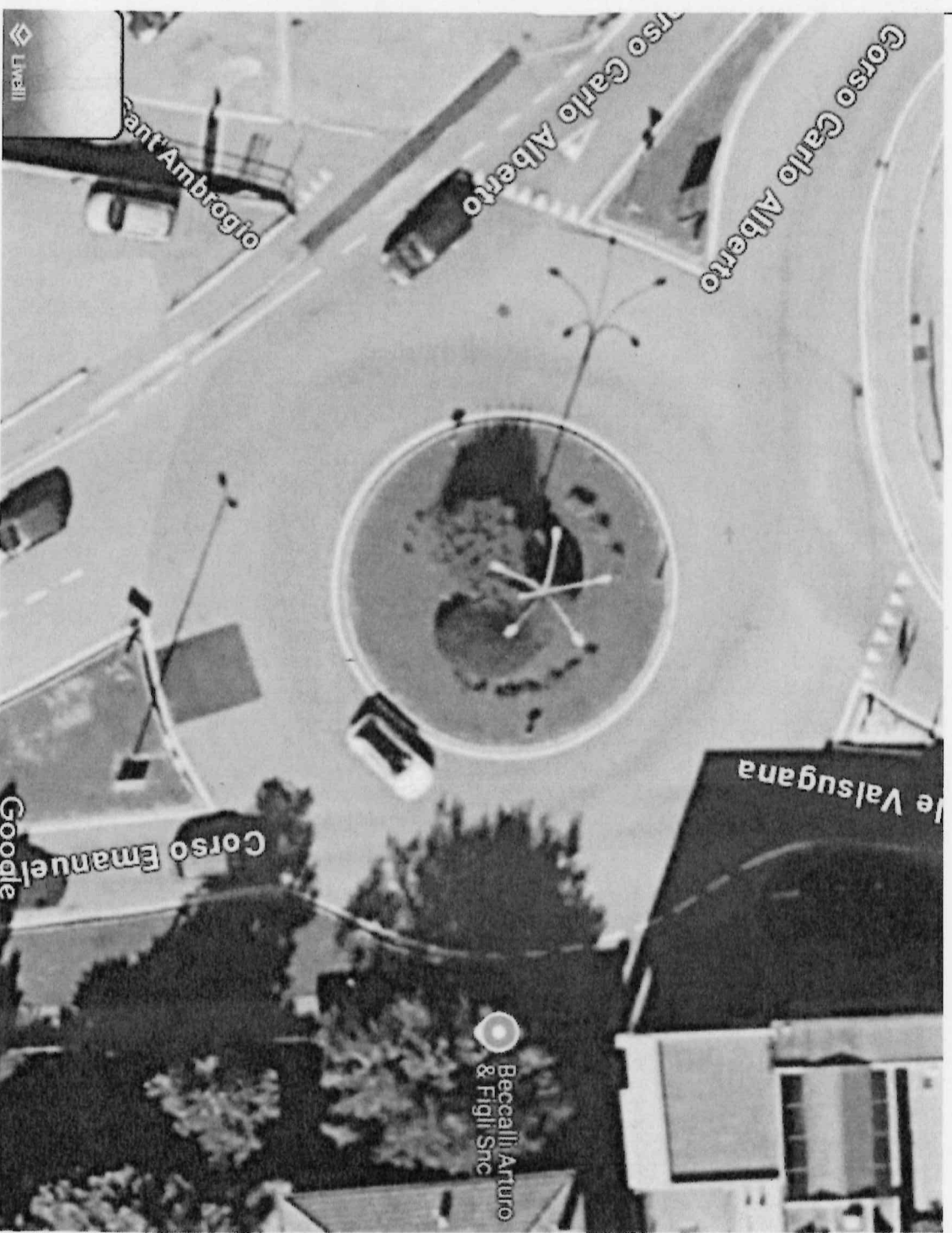
rotonda corso c. alberto viale valsugana Corso Carlo Alberto - Google Maps