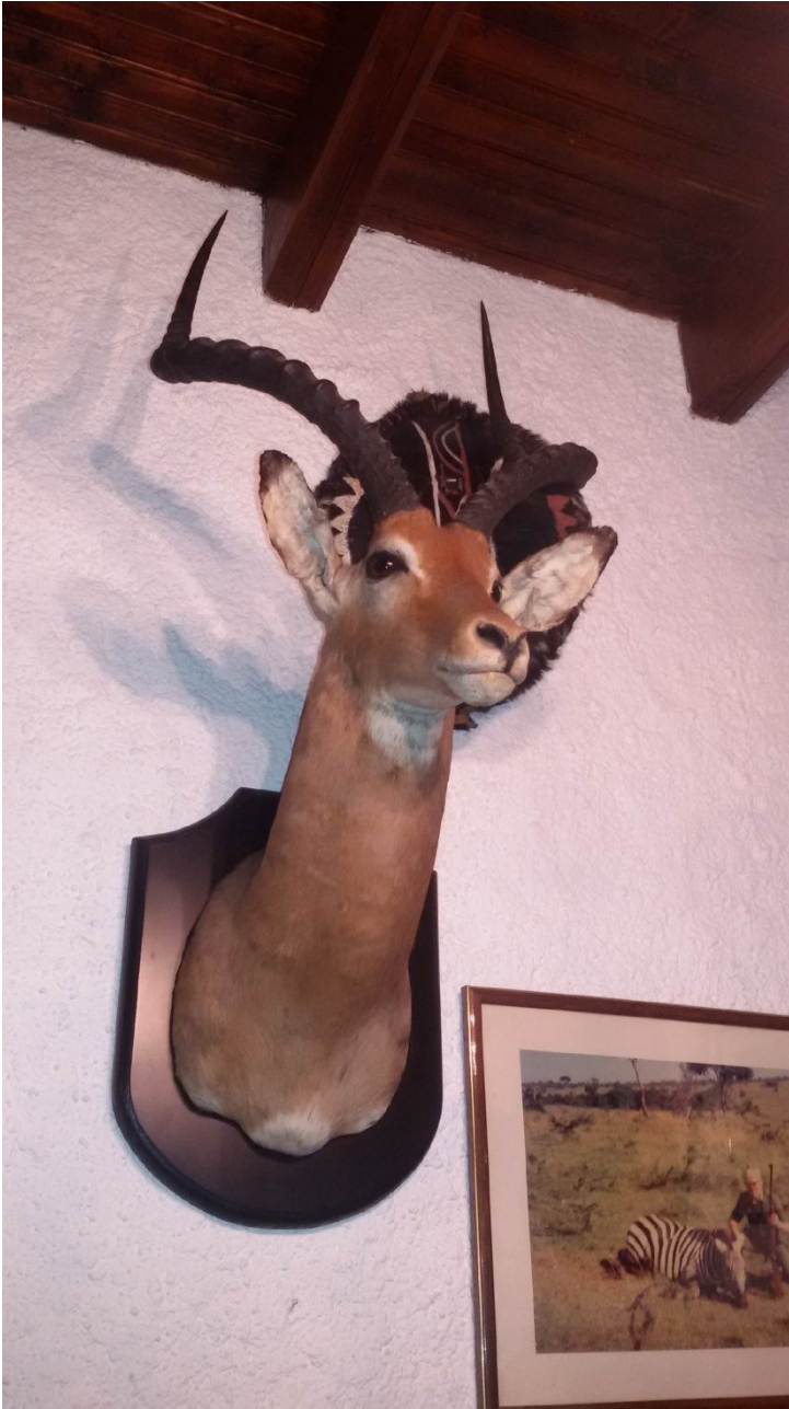
Aepyceros melampus (Impala)