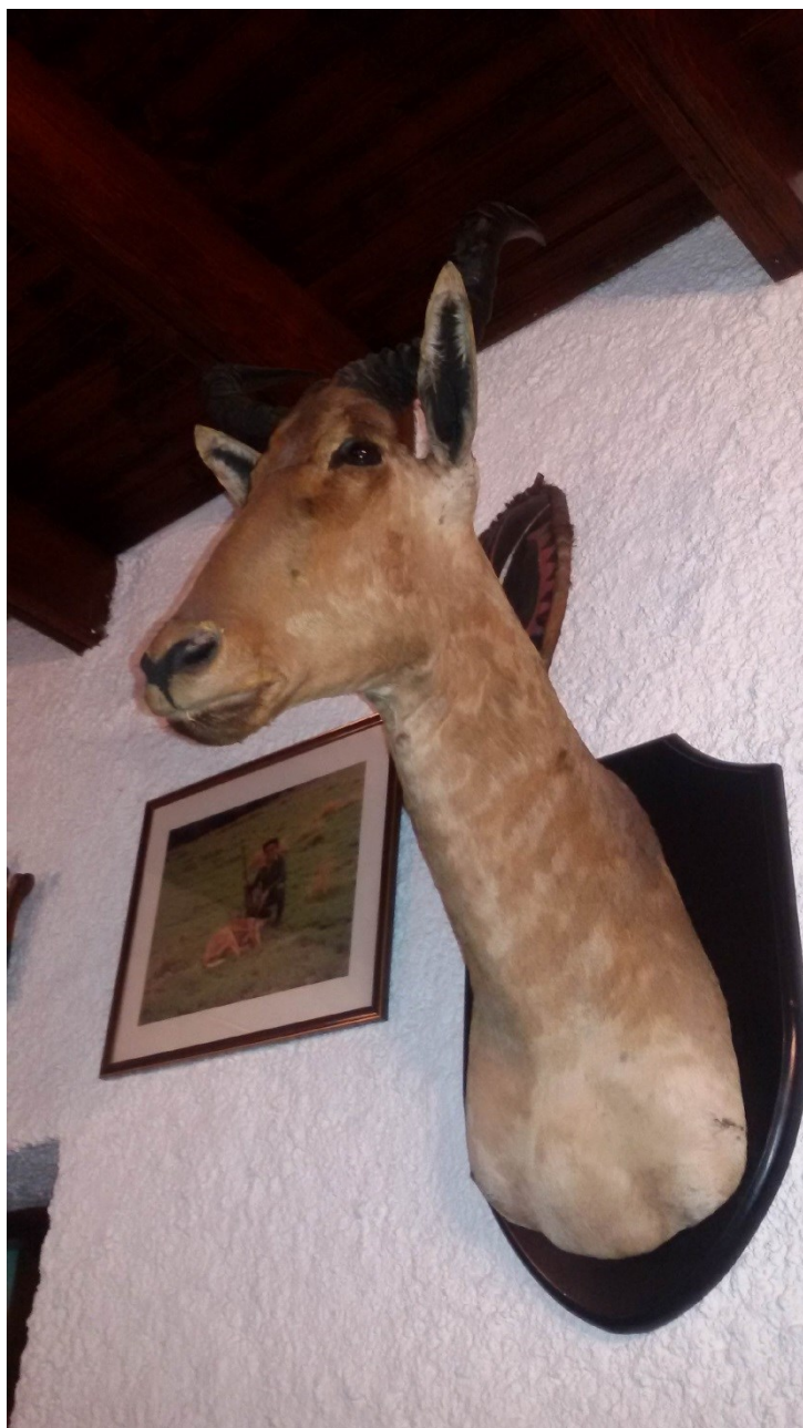
Alcelaphus buselaphus (Alcefalo)