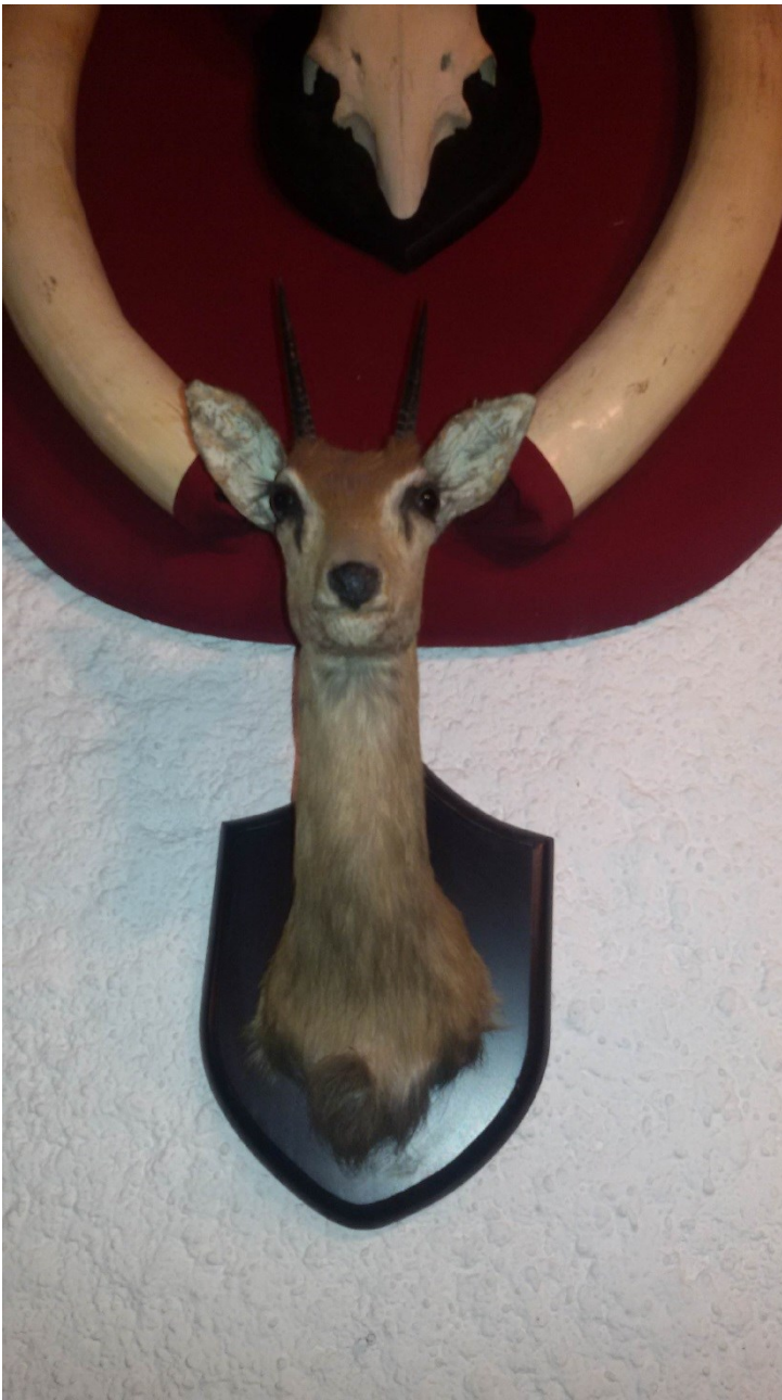
Ourebia ourebi (Oribi)