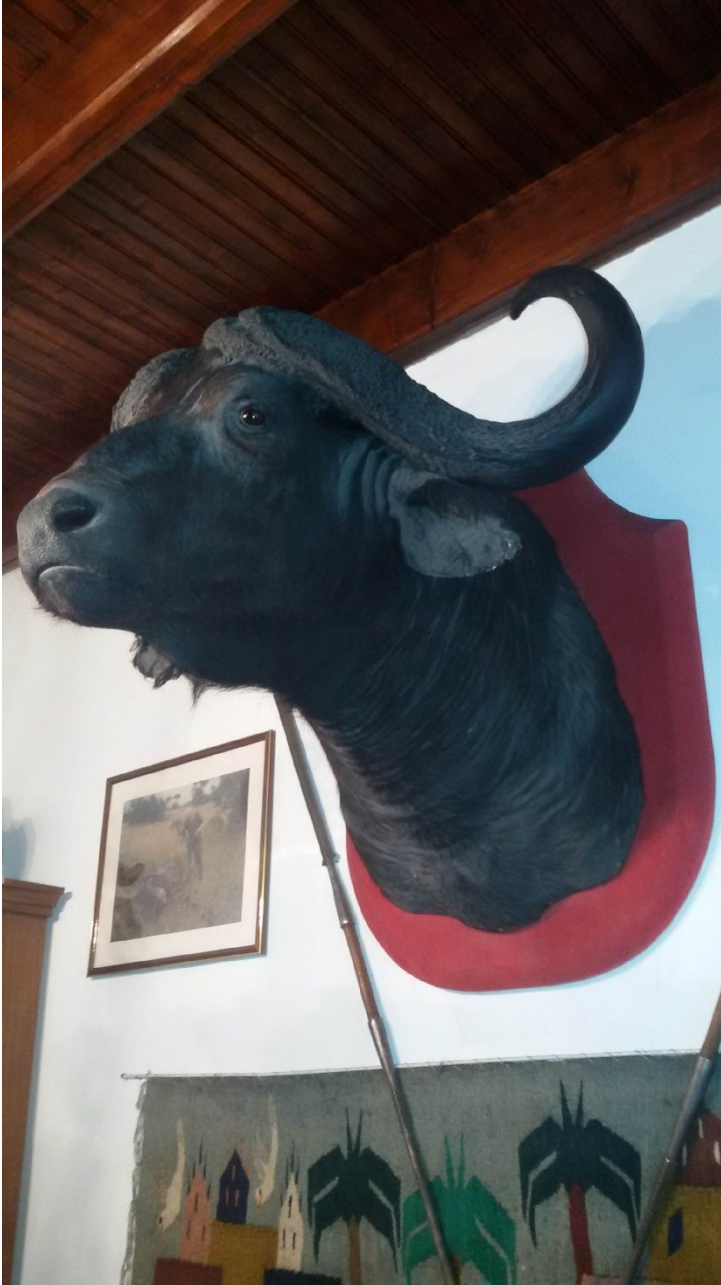
Syncerus caffer (Bufalo)