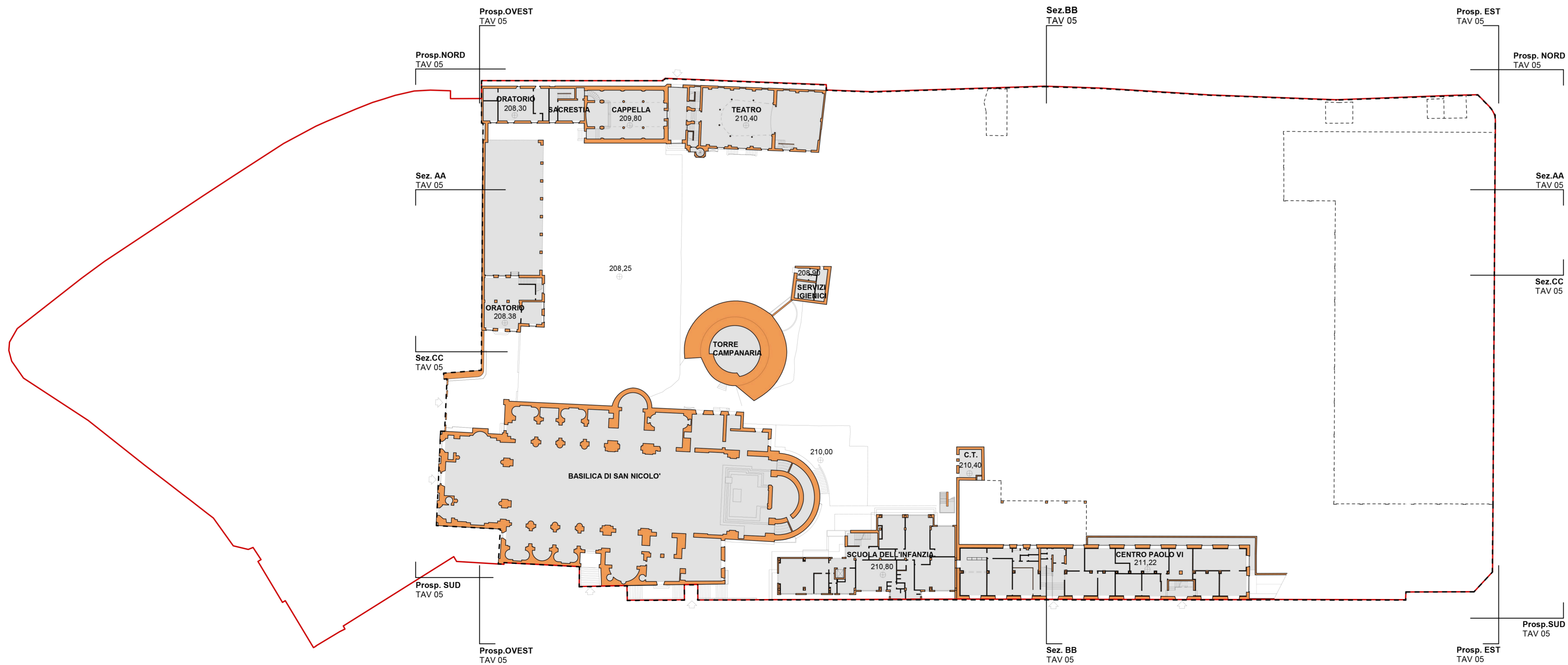
LIVELLO 0 (quota +211,00)

COMMITTENTE PARROCCHIA SAN NICOLÒ Via Canonica 4 - 23900 LC